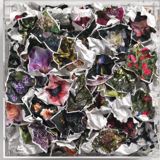
Forget me not

tankları resmeden ufak bir nakış koleksiyonum var. Tabii bunların bir kadın mı yoksa erkek mi tarafından yapıldığını bilmiyoruz. Edinburgh College of Art'ın dokumacılık bölümünde öğretmenlik yaptığım dönemde de işlerinde dikiş ve ipliği kullanan erkek öğrencilerle çalıştım, dolayısıyla bu tekniğin sadece feminenlikle alakalı olduğunu düşünmüyorum. Bu bağlamda, ben de işlerimde nakışın sadece bir kadın işi olması ve dekoratif bir aktivite olması fikirlerini araştırıyorum.