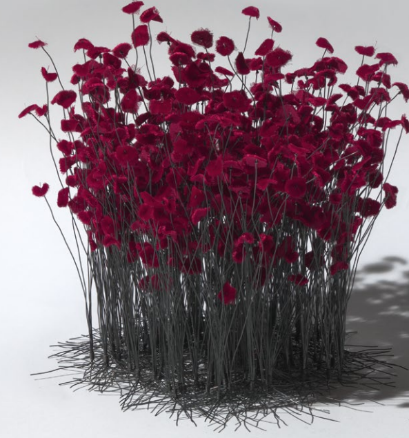
The garden of love

etmenin ve basit aletlerle karmaşık yüzeyler yaratmanın zorluklarını seviyorum. Bir şey yapmaya çabalamak bana gözlem yapma ve keşfetme fırsatı veriyor. El işi her şey, bu müzedeki bir sanat eseri veya anneannemin masa örtüleri olsun, bana ilham veriyor. Zaman içinde, gördüğüm motif, doku ve görseller bilinçaltımda canlanıyorlar ve işlerimde bir şekilde yerlerini alıyorlar. Teknoloji beni heyecanlandırıyor fakat bilgisayarın hala bir alet kutusu olduğunun farkındayım. İmgenin doğduğu yerin her zaman ben olmasını istiyorum, benim vizyonum, benim düşüncem olmalı. Photoshop ve video editing'i öğrendiğim yıllarda daha bu programlar çok yeniydi, dolayısıyla işimi fazlasıyla kolaylaştıracak kadar gelişmemişti ama yine de beni heyecanlandırıyordu. Bunu bir avantaj olarak görüyorum. Görsel manipülasyonunun, röprodüksiyonunun ve video editing'in bu kadar hızlı ilerlemesi gerçekten inanılmaz ama bir yandan da hepimizde bir görsel yorgunluk yarattı. Sanırım insanlar ekran ve mouse'tan uzaklaşmak için el yapımı işlere dönüyorlar.